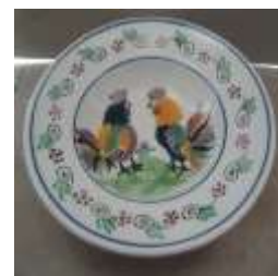
Χειροποίητο κεραμικό πιάτο Τεχν. Λαπήθου Τιμή: €13,80