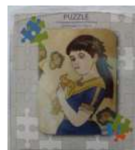
Παζλ σε διάφορα μεγέ- θη και σχέδια, εμπνευ- σμένα από εκθέματα του Μουσείου Τιμή: από €6,50

Στηρίξτε κι εσείς την παράδοσή μας. Αγοράστε μοναδικά δώρα εμπνευσμένα από την παράδοσή μας και στηρίξτε το Μουσείο Λαϊκής Τέχνης Κύπρου (ιδρ. 1937), στην προσπάθειά του να συντηρήσει τα εκθέματά του.