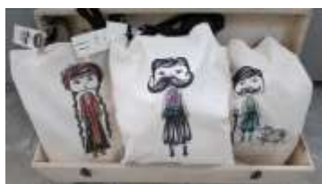
Τσάντα με μοντέρνο σχέδιο, εμπνευσμένο από κυπρια- κές φιγούρες Τιμή: €22