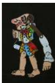
Φιγούρα Θεάτρου Σκιών με επένδυση δέρματος Τιμή: €30