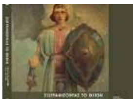
Κατάλογος Έκθεσης "Ζωγραφίζοντας το Θείο". 35 ευρώ. Για τα μέλη 24,50 ευρώ