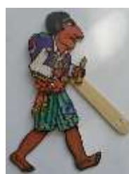
Ξύλινη φιγούρα Θεάτρου Σκιών με λαβή Τιμή: από €15