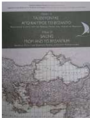
Κατάλογος Έκθεσης «ΟΛΚΑΣ II». Τιμή πώλησης: 21 ευρώ. Ειδική τιμή στην Έκθεση 15 ευρώ