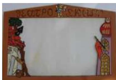
Σκηνή Θεάτρου Σκιών Τιμή: €52