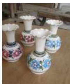
Χειροποίητα κεραμικά βάζα Τεχν. Λαπήθου Τιμή: από €9,50