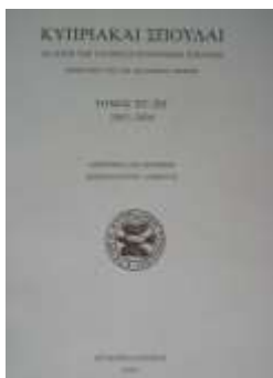
Κυπριακά Σπουδαί, Δημοσιεύθηκε έως το δίτομο, ΟΕ (2011).