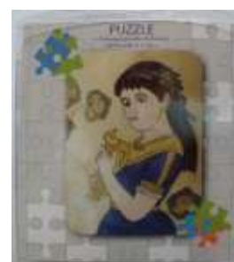
Παζλ σε διάφορα μεγέ- θη και σχέδια, εμπνευ- σμένα από εκθέματα του Μουσείου Τιμή: από €6,50