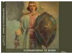
Κατάλογος Έκθεσης "Ζωγραφίζοντας το Θείο". 35 ευρώ. Για τα μέλη 24,50 ευρώ