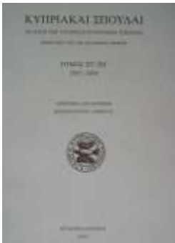
Κυπριακαί Σπουδαί, Δημοσιεύθηκε έως το δίτομο, ΟΕ (2011).