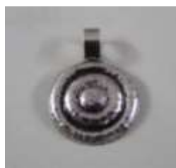
Ασημένιο κόσμημα για το λαιμό με τεχνική αναπαλαίω- σης Τιμή: €26