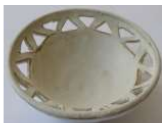
Διακοσμητικό λευκό πήλινο πιατάκι Τιμή: €8,50