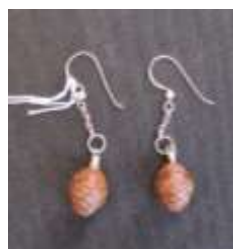
Σκουλαρίκια από αληθινούς καρπούς (κουκουνάρι) Τιμή: €17