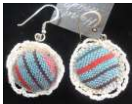
Χειροποίητα σκουλαρίκια από κυπριακό ύφασμα Τιμή: €19,50