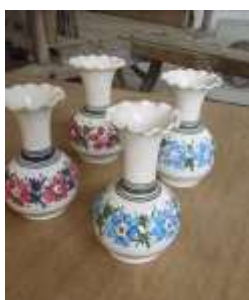
Χειροποίητα κεραμικά βάζα Τεχν. Λαπήθου Τιμή: από €9,50