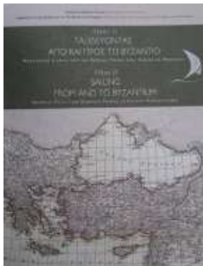
Κατάλογος Έκθεσης «ΟΛΚΑΣ II». Τιμή πώλησης: 21 ευρώ. Ειδική τιμή στην Έκθεση 15 ευρώ