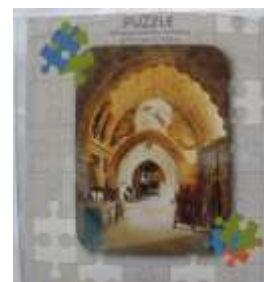
Παζλ σε διάφορα μεγέ- θη και σχέδια, εμπνευ- σμένα από εκθέματα του Μουσείου Τιμή: από €6,50