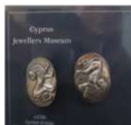
Ασημένια μανικετόκουμπα με σχέδιο λιονταριού Τιμή: €72