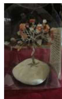
Χειροποίητο δεντράκι με λίθο carnelian Τιμή: €14