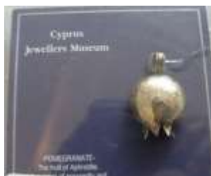
Ασημένιο κόσμημα για το λαιμό «ρόδι» Τιμή: €29