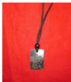
Μενταγιόν με σχέδιο του Αγ. Γεώργιο από ασήμι και δερμάτινο λουράκι Τιμή: €21