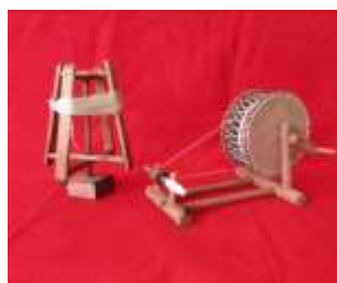
Ανέμη και Δουλάππι (μινιατούρες) Ειδική τιμή: €42 και τα δύο μαζί