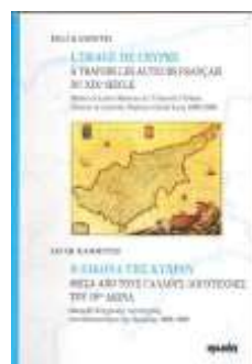
Η εικόνα της Κύπρου μέσα από τους Γάλλους λογοτέχνες του 19ου αι. Τιμή: €12

Στηρίζετε κι εσείς την παράδοσή μας. Αγοράστε μοναδικά δώρα εμπνευσμένα από την παράδοσή μας και στηρίζετε το Μουσείο Λαϊκής Τέχνης Κύπρου (ιδρ. 1937), στην προσπάθειά του να συντηρήσει τα εκθέματά του.