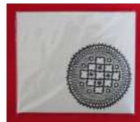
Χειροποίητα σημειωμάτνια με λευκαρίτικα μοτίβα Τιμή: από €10